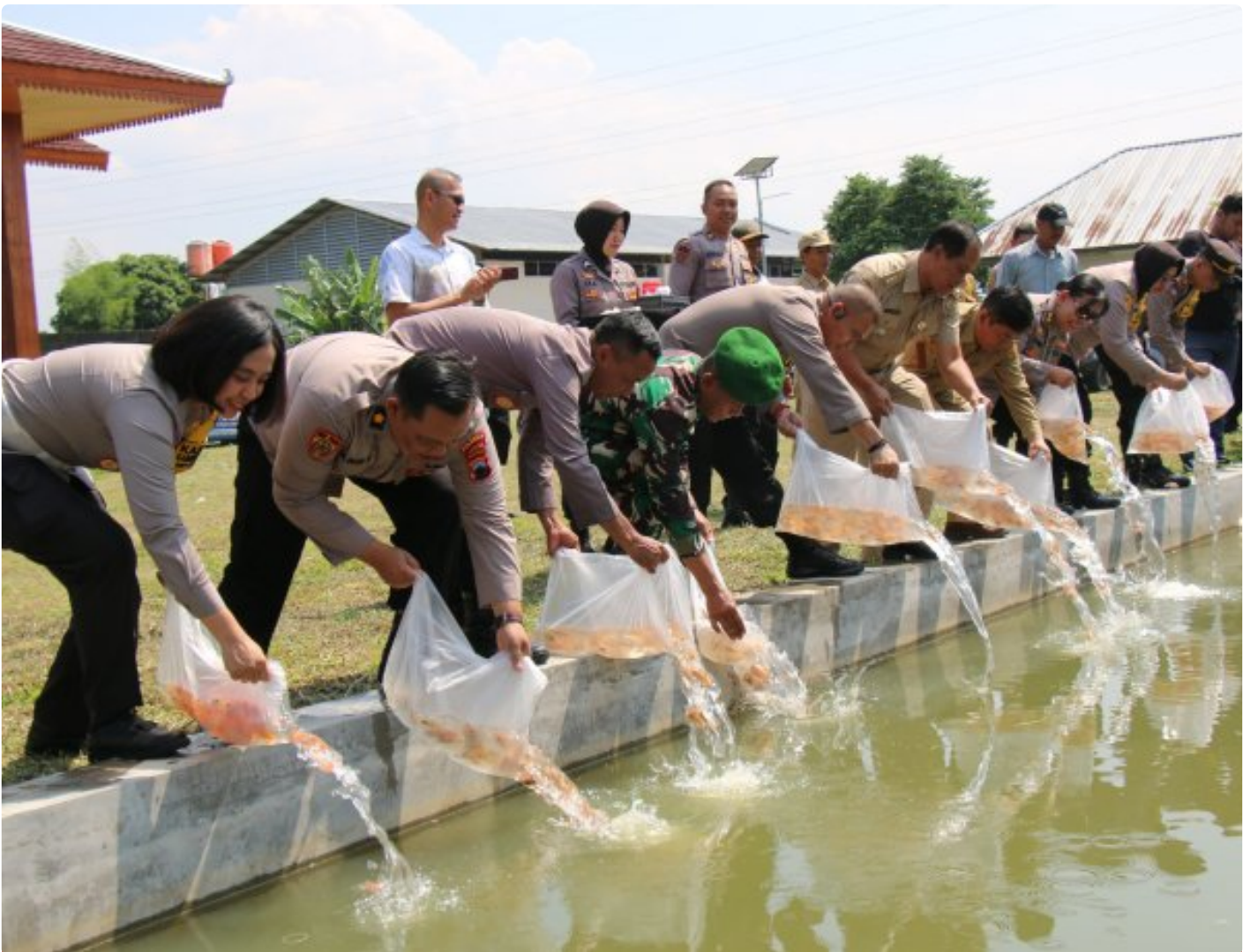
Foto: Polresta Magelang menebar 5.000 benih ikan di kolam Bumdes Desa Mertoyudan dan menanam 60.000 bibit jagung di lahan seluas 6.000 meter persegi di Dusun Kalimalang, Desa Mertoyudan, Kabupaten Magelang.

Magelang- Dalam semangat mendukung Program Asta Cita yang diusung Presiden Prabowo Subianto, Polresta Magelang meluncurkan aksi nyata untuk